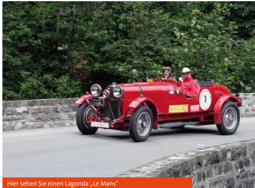
Hier sehen Sie einen Lagonda „Le Mans“

Ihr Oldtimer und unser Service gehören zusammen.